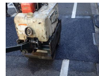
本復旧工 アスファルト舗装を新しく舗装する