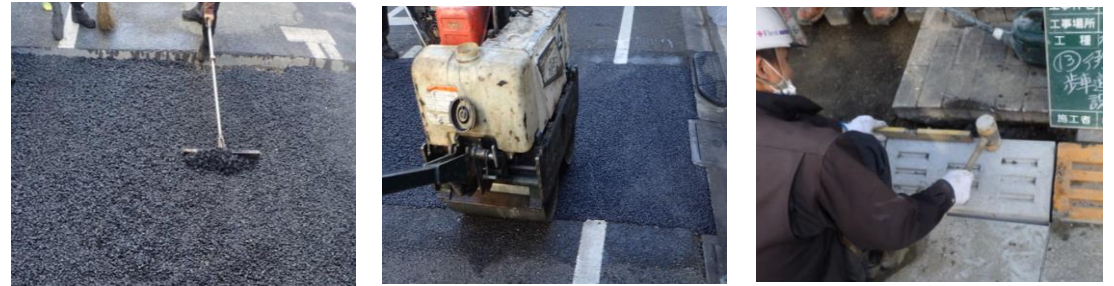
本復旧工 アスファルト舗装、街きょブロック等を新しく舗設する