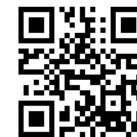
【弊社ホームページQRコード】

工事へのご理解とご協力の程、宜しくお願い申し上げます。 工事についてお問い合わせなどがございましたら 株千広興業 海老名までお声かけください。 工事のお知らせ（週間工事予定）は弊社ホームページでも 閲覧可能です。