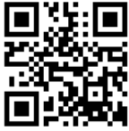
【弊社ホームページQRコード】

工事へのご理解とご協力の程、宜しく申し上げます。 工事についてお問い合わせなどがございましたら (株)千広興業 海老名までお声かけください。 工事のお知らせ(週間工事予定)は弊社ホームページでも 閲覧可能です。