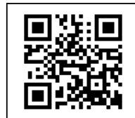
【弊社ホームページQRコード】

工事へのご理解とご協力の程、宜しくお願い申し上げます。 工事についてお問い合わせなどがございましたら (株)千広興業 海老名までお声かけください。 工事のお知らせ(週間工事予定)は弊社ホームページでも閲覧可能です。