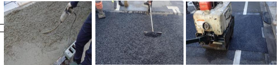
アスファルト舗装・セメントコンクリート舗装を新しく舗設する工事