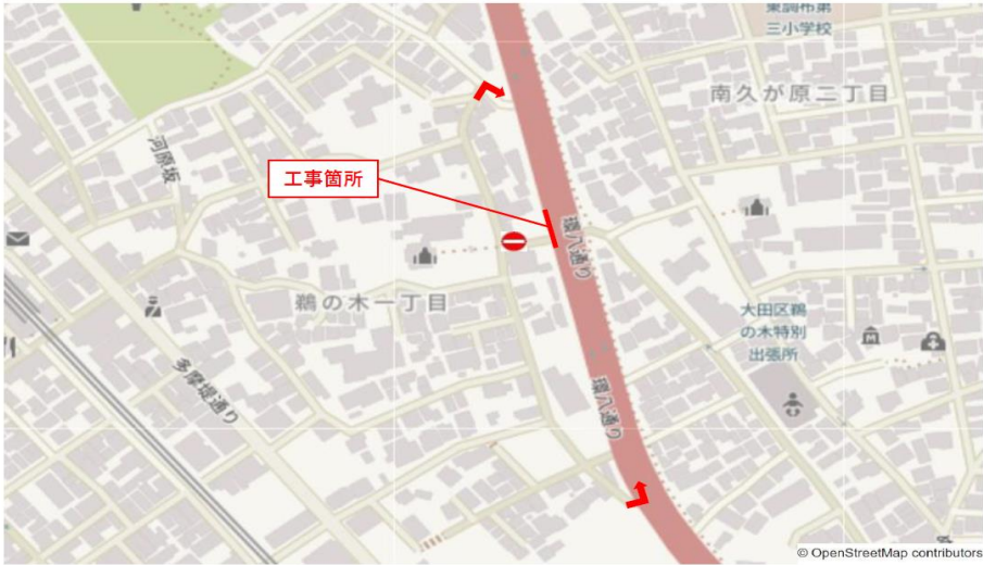
鶺の木1-4付近 施工時の迂回路図