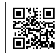
【弊社ホームページQRコード】

工事へのご理解とご協力の程、宜しくお願い申し上げます。 工事についてお問い合わせなどがございましたら 株式会社千広興業 海老名までお声かけください。 工事のお知らせ（週間工事予定）は弊社ホームページでも閲覧可能です。