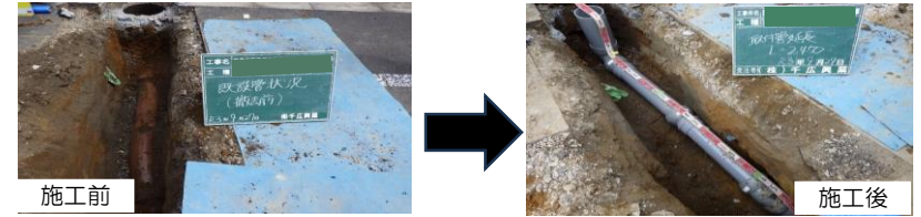
開削工：道路を掘削して古い管・ますを撤去し、新しい塩化ビニル管・ますへ取替