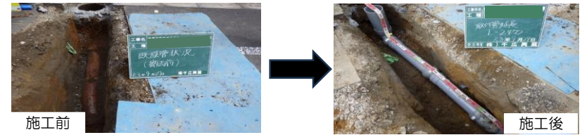
開削工：道路を掘削して古い管・ますを撤去し、新しい塩化ビニル管・ますへ取替