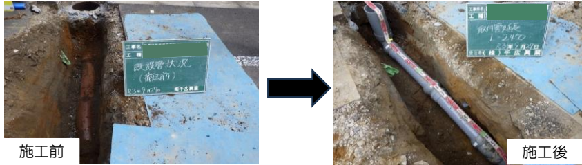
開削工：道路を掘削して古い管・ますを撤去し、新しい塩化ビニル管・ますへ取替