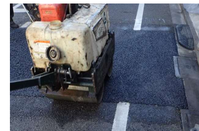
車道アスファルト舗装を新しく舗装する工事