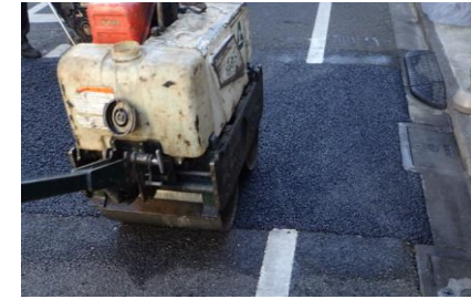
車道アスファルト舗装を新しく舗装する工事