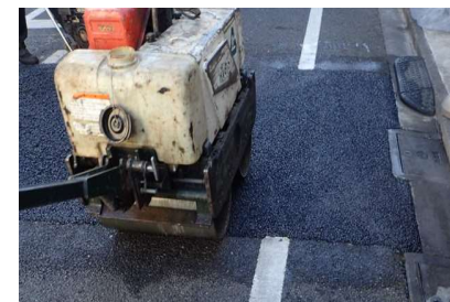
車道アスファルト舗装を新しく舗装する工事