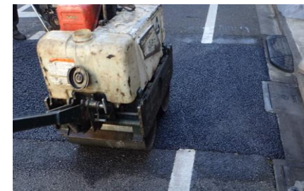
車道アスファルト舗装を新しく舗設する工事

※工事進捗・天候の都合により多少、日程が前後する場合があります。状況により作業が順延する可能性もあります。ご協力をお願いいたします。