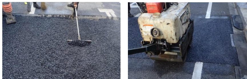
車道アスファルト舗装を新しく舗設する工事

※工事進捗・天候の都合により多少、日程が前後する場合があります。 状況により作業が順延する可能性もあります。 ご協力をお願いいたします。