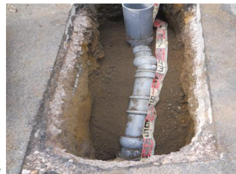
開削工事に道路を掘削して古い管を撤去し、 新しい塩化ビニル管へ入れ替え

内面被覆（非開削）工事の仕上げ作業を行います。 施工箇所ごと移動しながら車両通行止めを実施します。 規制する区域内でお車をお持ちの方へは施工前にお声掛け させていただきます。