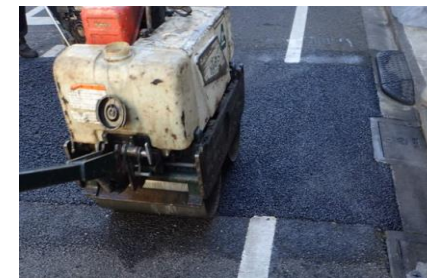
車道アスファルト舗装を新しく舗設する工事

※工事進捗・天候の都合により多少、日程が前後する場合があります。 状況により作業が順延する可能性もあります。 ご協力をお願いいたします。