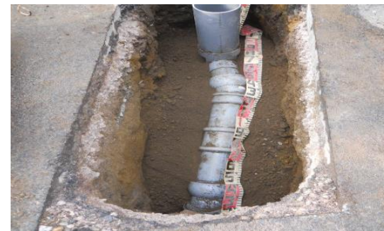
開削工事にて道路を掘削して古い管を撤去し、 新しい塩化ビニル管へ入れ替え

※工事進捗・天候の都合により多少、日程が前後する場合があります。 状況により作業が順延する可能性もあります。