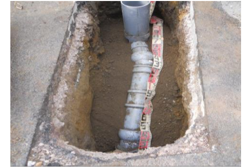
内面被覆工事にて補修した取付管