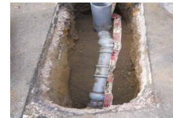
内面被覆工事にて補修した取付管