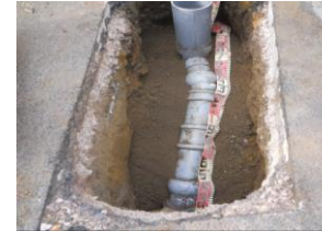
掘削して新しい塩化ビニル管へ入れ替えた取付管