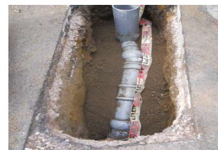
掘削して新しい塩化ビニル管へ入れ替えた取付管