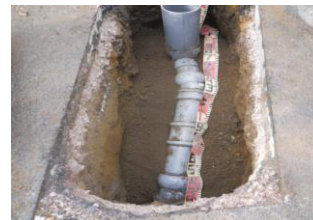
道路を掘削して古い管を撤去し、 新しい塩化ビニル管へ入れ替え