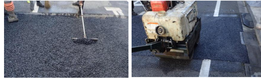
車道アスファルト舗装を新しく舗設する工事