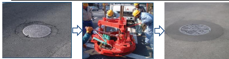
老朽化した鉄蓋受枠を交換します。