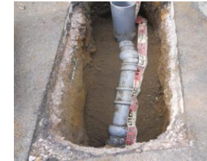
道路を掘削して古い管を撤去し、 新しい塩化ビニル管へ入れ替え