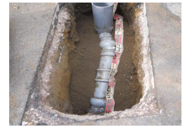
道路を掘削して古い管を撤去し、新しい塩化ビニル管へ入れ替え