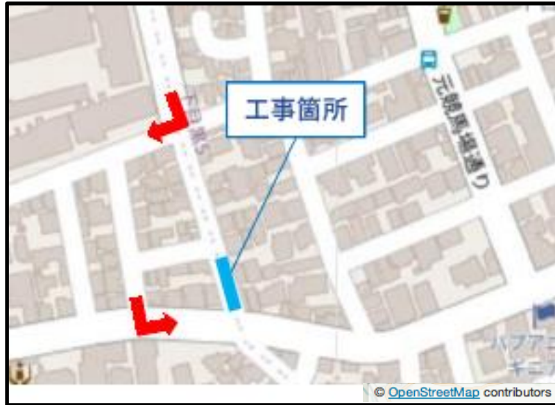
① 7月26日 内面被覆工