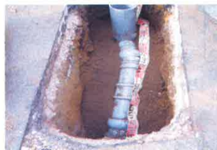
道路を掘削して古い管を撤去し、 新しい塩化ビニル管へ入れ替え