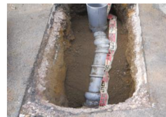
新しい掘削して 入替えた「本管と取付管」