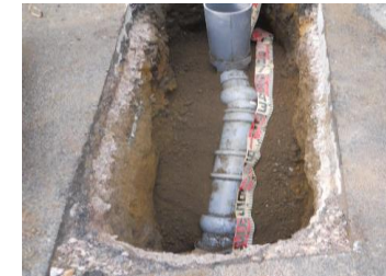
新しい「強化プラスチック管」へ 「旧管と取付管」を 入れ替えています。