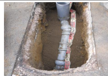
新しい強化ポリ管へ 入替えた「本管と取付管」