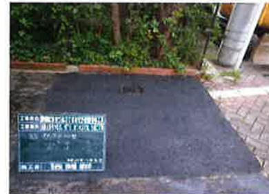
仮の舗装をはがし仕上げの舗装にします。