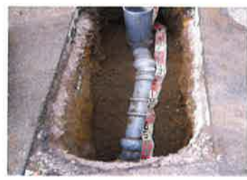
新しい環境して 入替えた「本管と取得管」