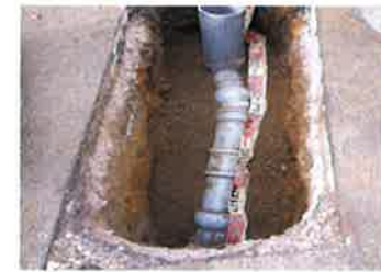
新しい管として 掘削して 入れた「本管と取付管」