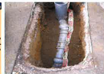
内面被覆工事にて補修した本管