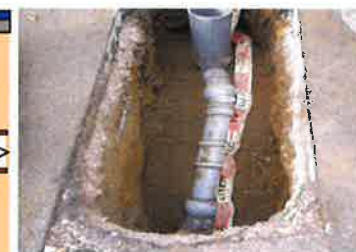
内面被覆工事にて補修した本管