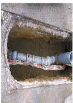
掘削して新しい塩化ビニル管へ入れ替え工事